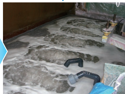
スラジイーターのしくみ