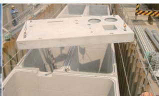
弁当工場の排水処理