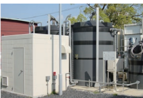
食堂及び鋳物油排水の処理