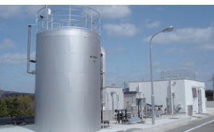
製パン工場排水の処理