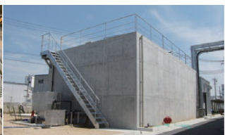
食品加工場の排水処理