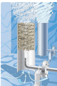
アクアブラスターのしくみ

空気を送り込むことで、下から水を吸い上げ、内部で激しく気液接触させて、酸素を水中に送り込みます。詳しくはホームページの動画をご覧ください。